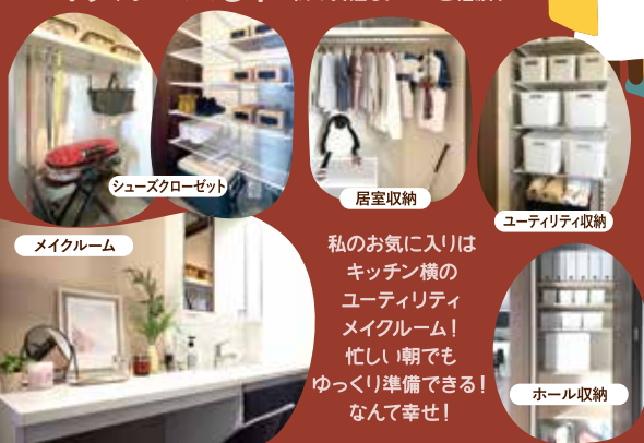
シューズクローゼット