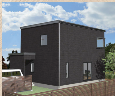
※外観はバースによるイメージ