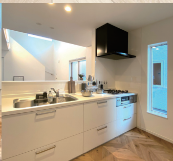
統一感のある水回りデザイン