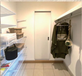
玄関から土間つづきのクローゼット