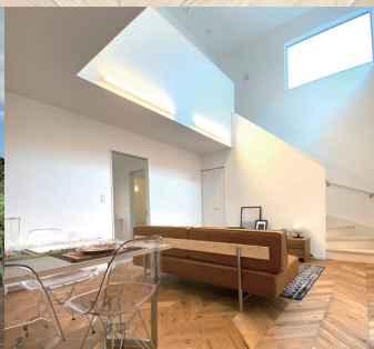
開放感のある吹抜